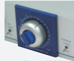
アッテネーター操作部